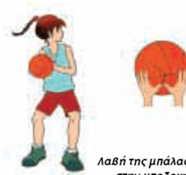
Λαβή της μπάλας στην υποδοχή